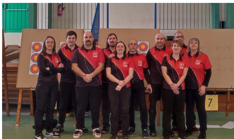
Les équipes hommes et femmes au championnat de Bretagne en salle 2023