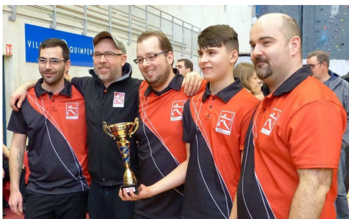
L'équipe vice-championne de Bretagne en salle 2019

Vous trouverez plus de détails concernant nos palmarès sur le site internet : https://www.archers-kervignac.fr/ .